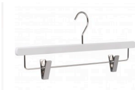
Muster des Bügels

Das Museumsteam garantiert die Hängung von mindesten 1 Kunstwerk pro KünstlerIn.